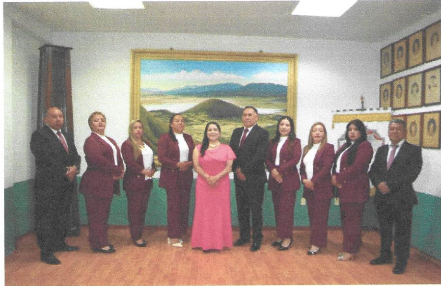
INTEGRANTES DEL AYUNTAMIENTO CONSTITUCIONAL DE ACAMBAY DE RUIZ CASTAÑEDA, ESTADO DE MÉXICO, 2025-2027.