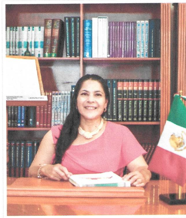
C. ANGÉLICA COLÍN PACHECO PRESIDENTA MUNICIPAL CONSTITUCIONAL DE ACAMBAY DE RUIZ CASTAÑEDA, MÉXICO.

En ejercicio de las atribuciones que me confieren los artículos 128, fracciones II y III de la Constitución Política del Estado Libre y Soberano de México; y 48, fracciones II y III de la Ley Orgánica Municipal del Estado de México, a todos los habitantes del Municipio, hago saber: Que el Ayuntamiento Constitucional de Acambay de Ruíz Castañeda, en cumplimiento con lo dispuesto por los artículos 115, fracción II de la Constitución Política de los Estados Unidos Mexicanos, 112, 113, 116, 122, 123 y 124 de la Constitución Política del Estado Libre y Soberano de México; 2, 3, 31, fracción I; 160, 161, 162, 163, 164 y 165 de la Ley Orgánica Municipal del Estado de México; mediante la Quincuagésima Primera Sesión Ordinaria de Cabildo, de fecha 15 de enero de 2026, ha tenido a bien aprobar y expedir el siguiente: